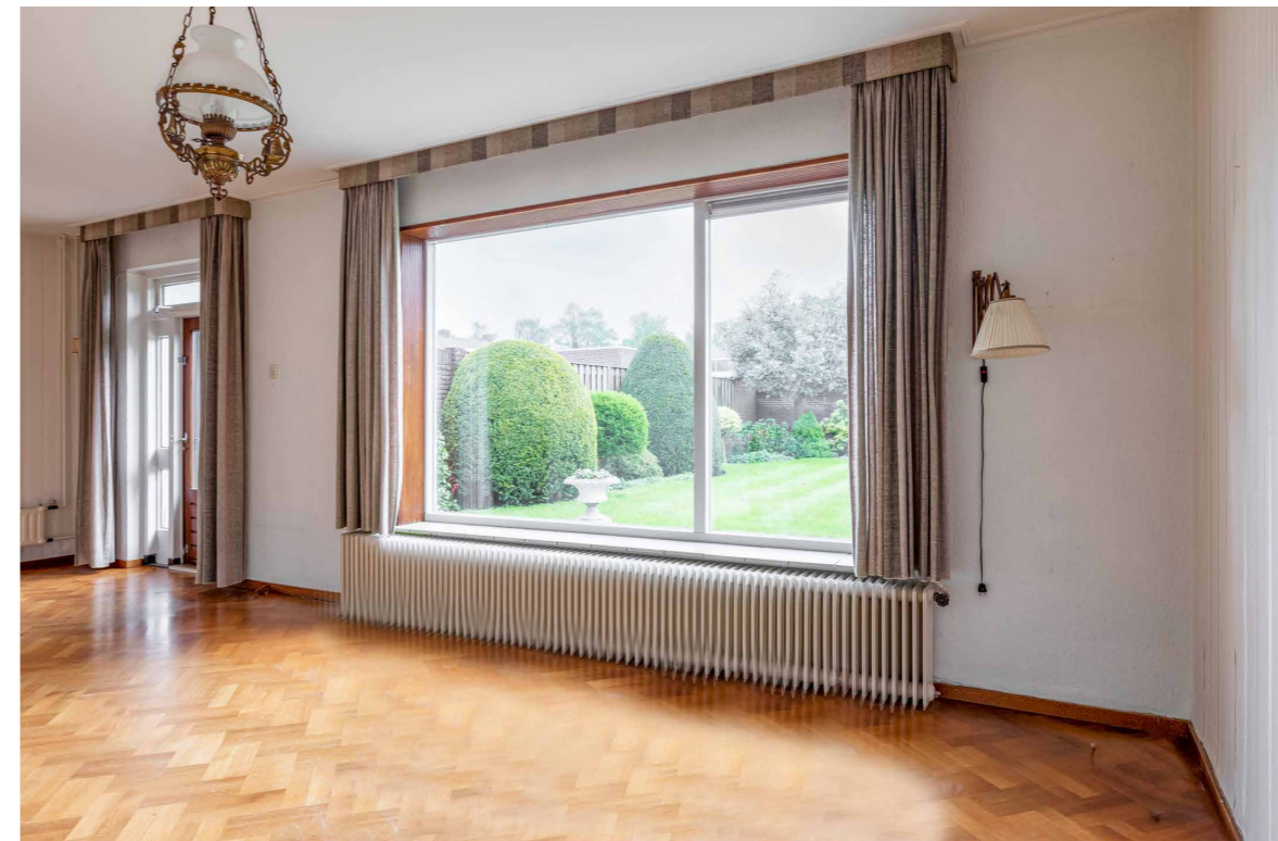
De woonkamer is voorzien van een visgraat parket vloer en een gaskachel.